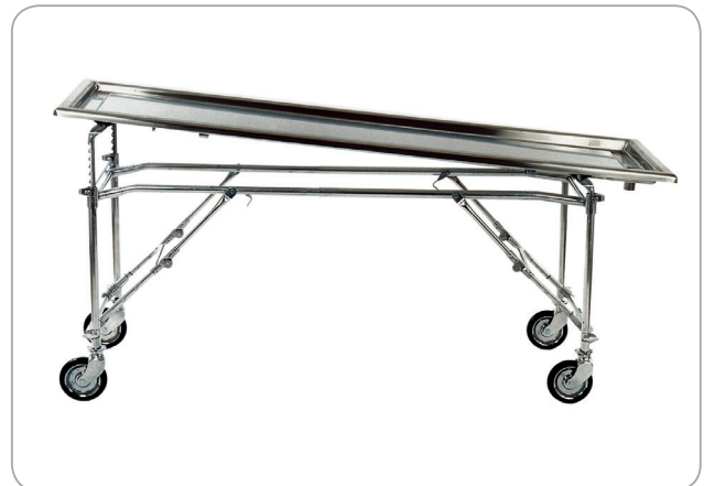
Schräglage der Arbeitsfläche ist möglich