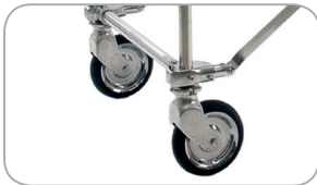
Schwenkbare Laufräder mit Richtungsfeststeller