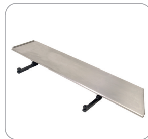
Verbreiterungsteile als Zubehör lieferbar