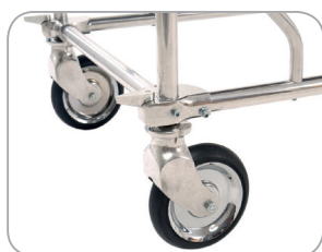
Schwenkbare Laufräder mit Richtungsfeststeller