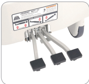
Pedale zur einseitigen und beidseitigen Höhenverstellung sowie zum Absenken