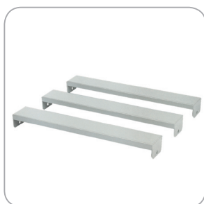
Body Bridge 38-BB als Zubehör lieferbar

Die maximale Belastbarkeit des Tisches beträgt 450 kg.