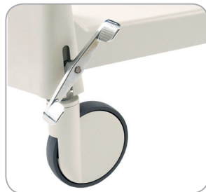
Hochwertige Laufrollen mit Zentralfeststellung gehören zur Grundausstattung