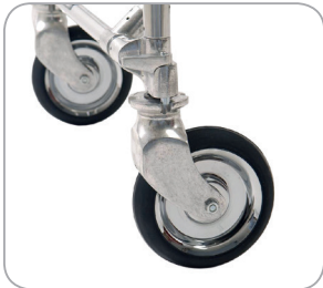
Laufräder mit Richtungsfeststeller

Die Maße der Arbeitsplatte sind 205 x 77 cm, die Höhe des Tisches kann von 83-99 cm eingestellt werden.