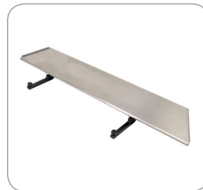
Verbreiterungsteile als Zubehör lieferbar