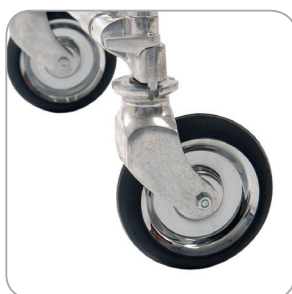
Laufräder mit Richtungsfeststeller