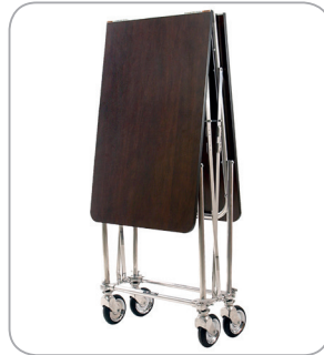
Ankleidetisch 34 geklappt