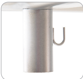
Abflusstutzen gehört zur Grundausstattung