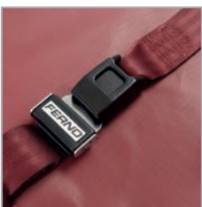
Haltegurt 430, zweiteilig

Zubehör (teilweise im Lieferumfang enthalten)