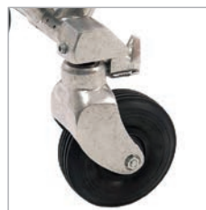
Schwenkrollen mit Spurfeststeller