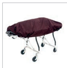
Abdeckung 0314104, weinrot